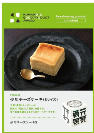
▼商品POP制作イメージ