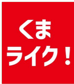
くまライク！氏 ・インフルエンサー ・熊本グルメを各種SNSで発信 ・Instagramフォロワー9万人超